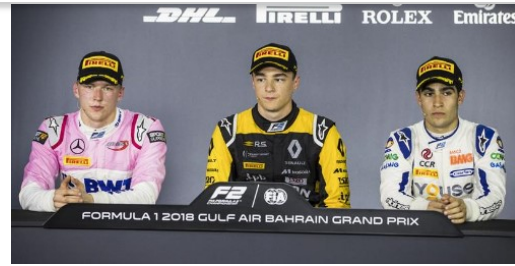
Max in der FIA Top 3 Pressekonferenz in Bahrain.